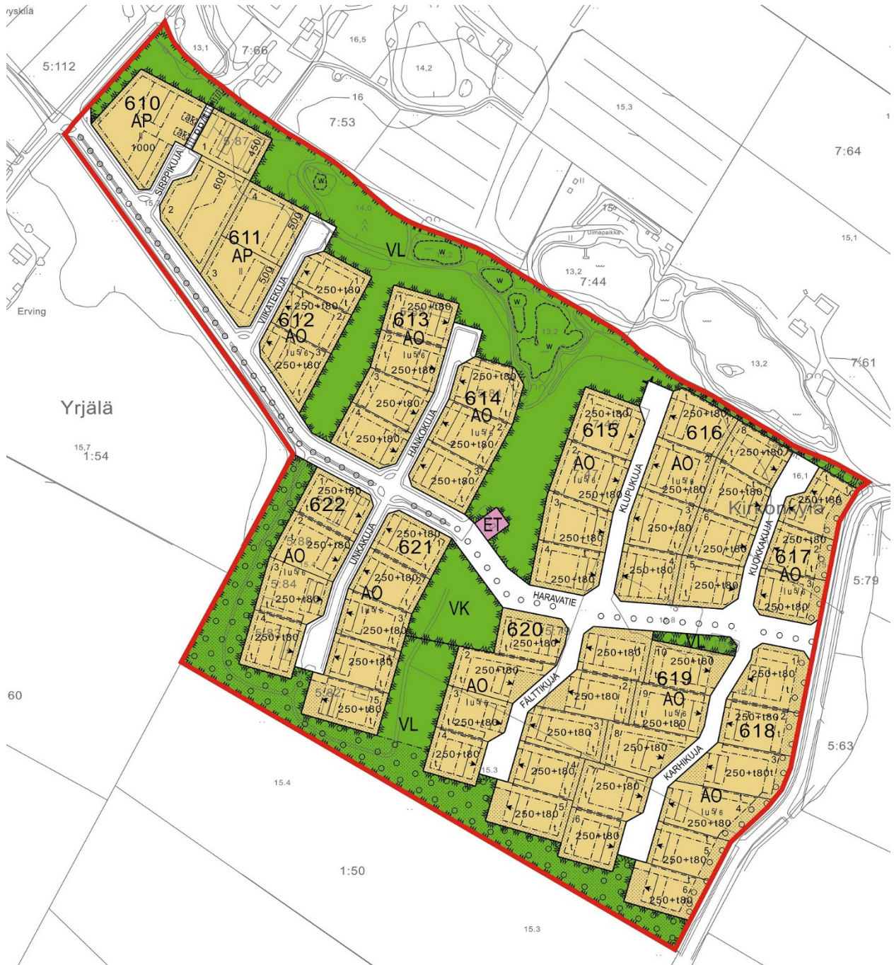
Kuva 2. Ote asemakaavayhdistelmästä ja suunnittelualueen rajaus.